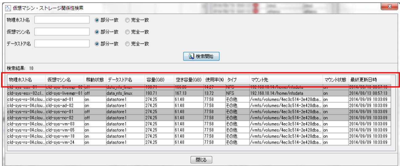
<仮想マシン・ストレージ関係性検索画面>

MoonWalker をご利用いただいているユーザーの要望に基づき、仮想サーバからみたストレージの関連情報を検索・表示する機能を提供します。