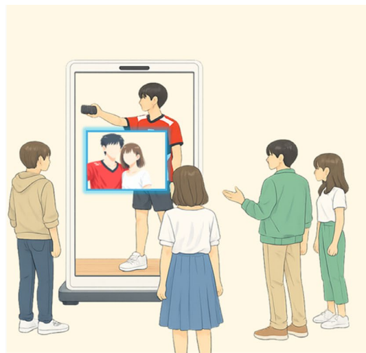
「PROTO」による体験演出 『スポーツ選手と記念撮影』